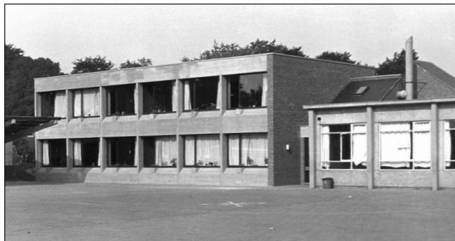
Broederschool anno 1986

De voordracht is bedoeld voor iedereen die de beginjaren van de Broederschool heeft meegemaakt. Ook oud-leerlingen die in latere jaren de klassen in de Pastoor Vandenhoudtstraat hebben gevuld - en misschien wel onveilig hebben gemaakt - zijn van harte